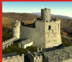
ricostruzione ipotetica 3d del castello in epoca post-rinascimentale