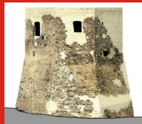
Il Mastio ottagonale dopo il restauro

ricostruzione 3d delle fasi storiche, si possono visitare i camminamenti sotterranei e le mura antiche.