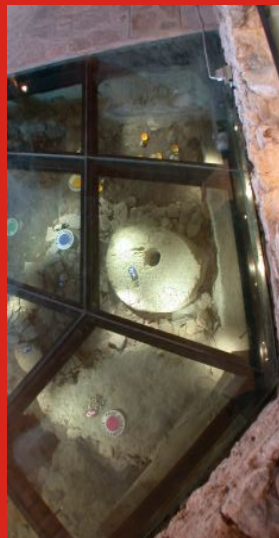
resti archeologici visibili

Oltre al Mastio, dove si trovano le suppellettili, i resti archeologici e la postazione multimediale con