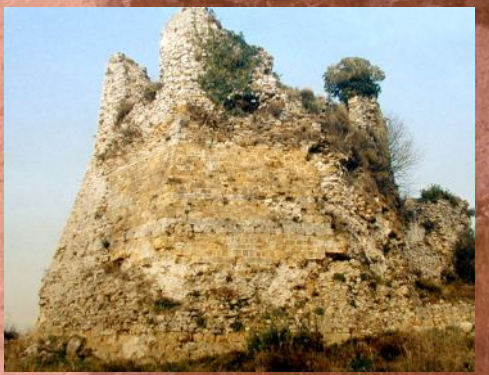
il mastio ottagonale prima del restauro.

Attorno alla metà del secolo XVIII, nonostante le richieste dei Montignosini