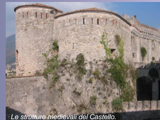
Le strutture medievali del Castello.

invasioni nemiche. Il tutto doveva avere diverse recinzioni lungo il pendio del colle. Una terza fase cronologica è contraddistinta dall'ampliamento in epoca rinascimentale della rocca, effettuato da Giacomo Malaspina e dai suoi discendenti.