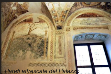
Pareti affrescate del Palazzo

della Vicaria che volessero costruirvi una casa. Inoltre fu irrobustita la cinta muraria del poggio e vennero promulgate severe disposizioni perché non si costruisse a ridosso di essa o perché si chiudessero delle aperture già esistenti: tutto ciò con evidente scopo difensivo per il borgo interno.