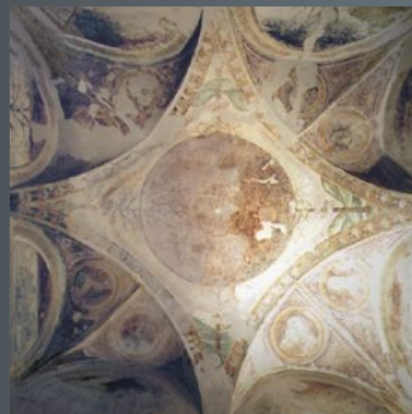
Il soffitto della Sala della Spina

Da documenti d'archivio sappiamo che verso la prima metà del XV secolo anche a Massa si fecero dei lavori nelle fortificazioni di base del perimetro della fortezza, ampliando le fondamenta murarie difensive. Un altro documento