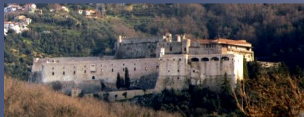
Veduta del Castello.

In epoca medioevale, quindi, cioè dal secolo XI all'inizio del XV, l'incastellamento si era avuto sullo sperone più alto della collina rocciosa e si era evoluto dalla condizione di unica torre recintata a piccolo fortilizio mediante allargamento della parte residenziale ed aggiunta di torrette nella cortina muraria merlata. Al posto del palazzo malaspinese vi erano solo, probabilmente, poche costruzioni in legno che fungevano come magazzino o piccole abitazioni provvisorie per gli abitanti delle case sottostanti al castello, da sfruttare in caso di pericolo di