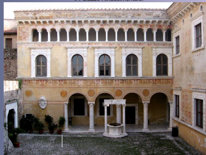
Il Palazzo Rinascimentale.

Per ottenere l'orario di apertura più aggiornato collegarsi al sito internet: www.istitutovalorizzazionecastelli.it